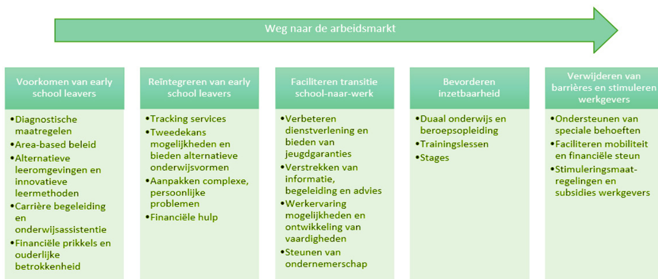
Figuur 1: Categorieën en bijbehorende beleidsmaatregelen

Door de impact van de economische crisis is er een gevoel van urgentie ontstaan om beleid te ontwikkelen en te implementeren om jongeren in Europa (weer) aan het werk of studeren te krijgen. In dit onderzoek zijn alle beleidsmaatregelen in kaart gebracht die gericht zijn op de toegang van jongeren tot de arbeidsmarkt en zijn geïntroduceerd in respons op de crisis. De beleidsmaatregelen grijpen in op verschillende punten langs de weg naar de arbeidsmarkt (Eurofound, 2012a, p.108). Eurofound (2012a) karakteriseert deze punten in vijf categorieën: (1) het voorkomen van vervroegde schoolverlaters, (2) het re-integreren van vervroegde schoolverlaters, (3) het faciliteren van de transitie van school-naar-werk, (4) het bevorderen van de inzetbaarheid van jongeren, en (5) het verwijderen van barrières en stimuleren van werkgevers. Deze categorieën zijn in dit onderzoek gebruikt als indicatoren om de nationale beleidsrespons op de crisis te categoriseren. Op deze manier is in kaart gebracht op welke punten de overheid ingrijpt in de weg naar de arbeidsmarkt en zijn trends geïdentificeerd. In Figuur 2 zijn de categorieën