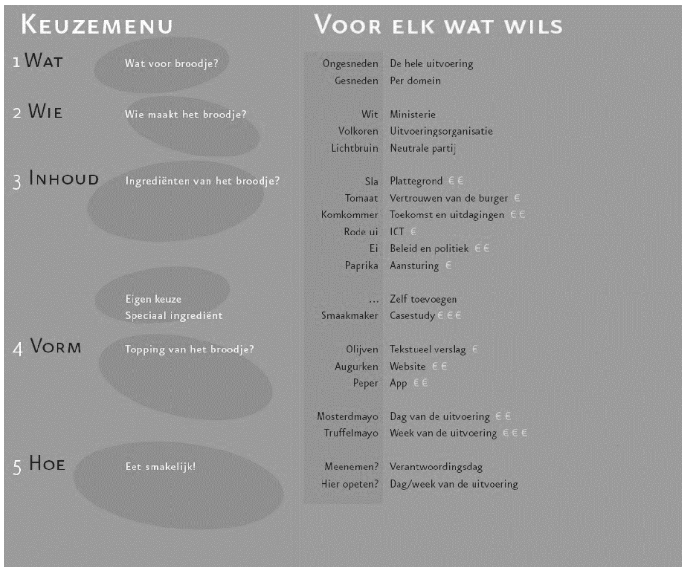
Figuur 1: Een schematische weergave van het keuzemenu voor een Staat van de Uitvoering, geïnspireerd op basis van het broodjes-concept van de Subway. Dit keuzemenu stelt besluitvormers in staat om een eigen Staat van de Uitvoering samen te stellen, waarbij de volgende vragen centraal staan: (1) Wat voor Staat van de Uitvoering wilt u? (2) Wie maakt de Staat van de Uitvoering? (3) Welke onderdelen wilt u in de Staat van de Uitvoering? (4) Welke vorm geeft u een Staat van de Uitvoering? (5) Hoe presenteert u de Staat van de Uitvoering?

Tegelijkertijd heeft ABDTOPConsult de aanbeveling gedaan om de publicatie van een Staat van de Uitvoering te koppelen aan Verantwoordingsdag. Op die manier is er direct publiciteit op landelijk niveau en wordt er rekening gehouden met de begrotingscyclus van de Rijksoverheid (ABDTOPConsult, 2020). Een eventueel nadeel is dan wel dat de Staat van de Uitvoering ondergesneeuwd kan raken tussen de andere (financiële) rapporten en jaarverslagen. Bovendien kan de Staat van de Uitvoering dan het karakter van een verantwoordingsdocument krijgen, terwijl dit expliciet niet de bedoeling is.